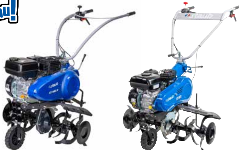
ST 4862 R